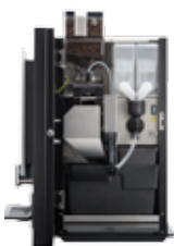
OB 3 (XL) NG