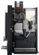
OB 2 (XL) NG